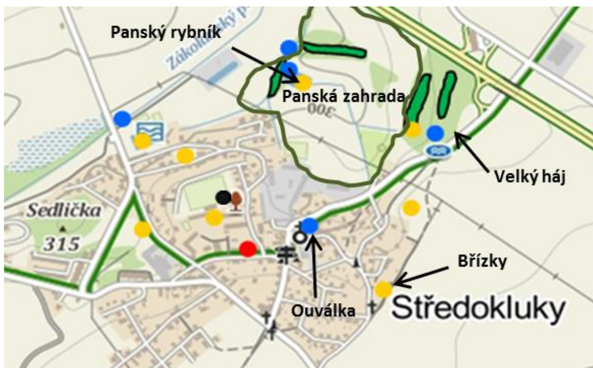
Obr. 3 Jednotlivá stanoviště v okolí Středokluk. Červeným bodem je vyznačena poloha školy, černým místem, kde probíhala úvodní hra. Modré body označují hydrobiologická stanoviště, oranžové body stanoviště týmu věnujícího se vývoji krajiny. Zeleně jsou vyznačena území, kde se děti zabývaly vývojem stromového porostu. Linie je vyznačeno přibližné území Panské zahrady.