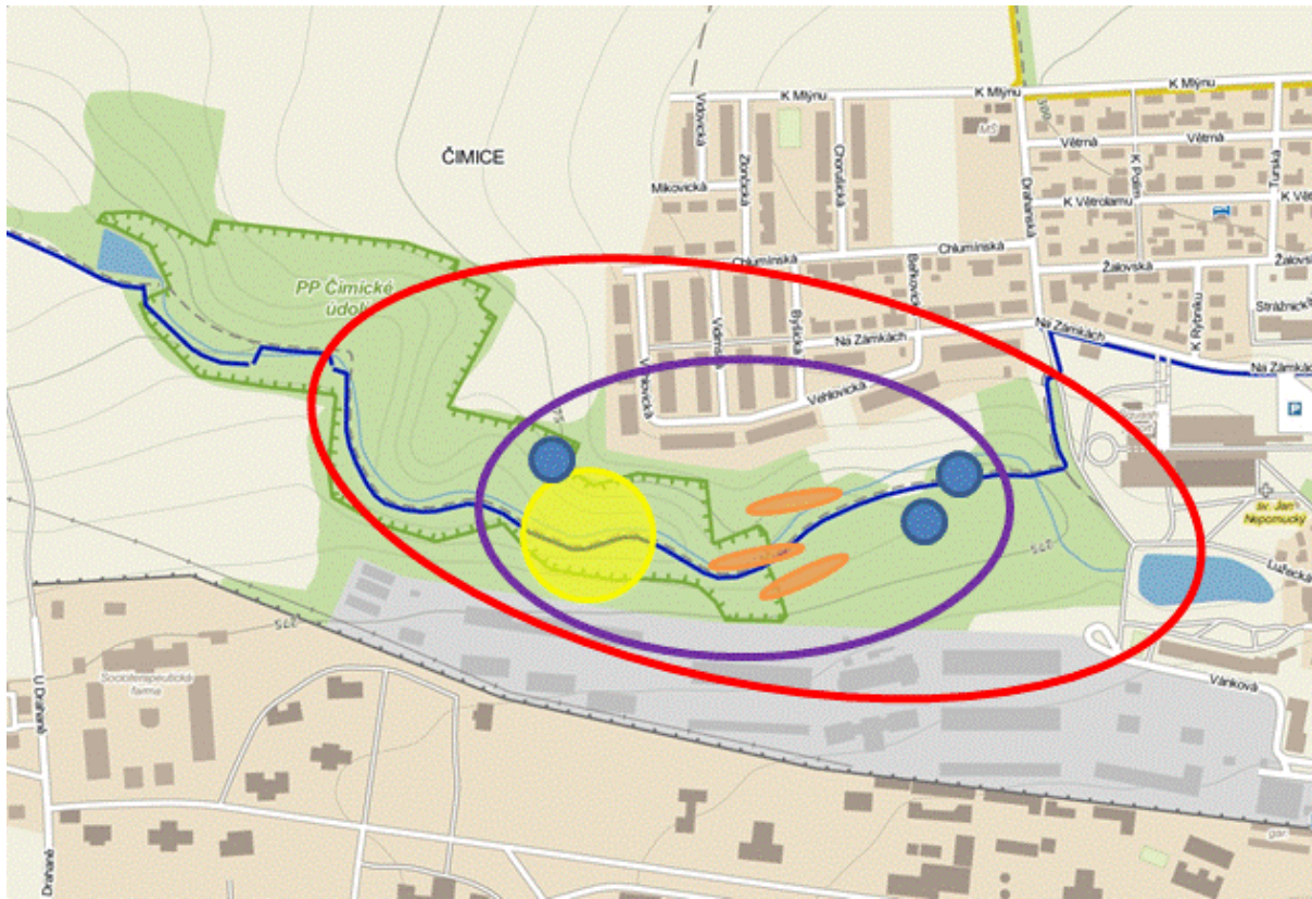
Obr. 1 Na mapě Čimického údolí jsou vyznačena zkoumaná území jednotlivých týmů. Žlutě je oblast týmu, který se zabýval indikačními druhy rostlin, modře jsou čtverce týmu zkoumajícího strukturu dřevinného porostu, oranžově jsou transekty týmu, který se zabýval také stromovým porostem, fialově je oblast zájmu týmu mapujícího ovocné stromy a červeně zkoumané území týmu sledujícího proměny krajiny.

Další tým se zabýval stromovou strukturou ve třech transektech. Jeden vedl nivou potoka, druhý po jižním a poslední po severním svahu údolí. Úkolem tohoto týmu bylo změřit a zaznamenat stromy v transektu do tabulky. Vyskytl se zde problém s nerespektováním kapitána a jeho nezájmem o zapojení ostatních členů skupiny do aktivity, u které si s jedním týmákem skoro vystačili sami.