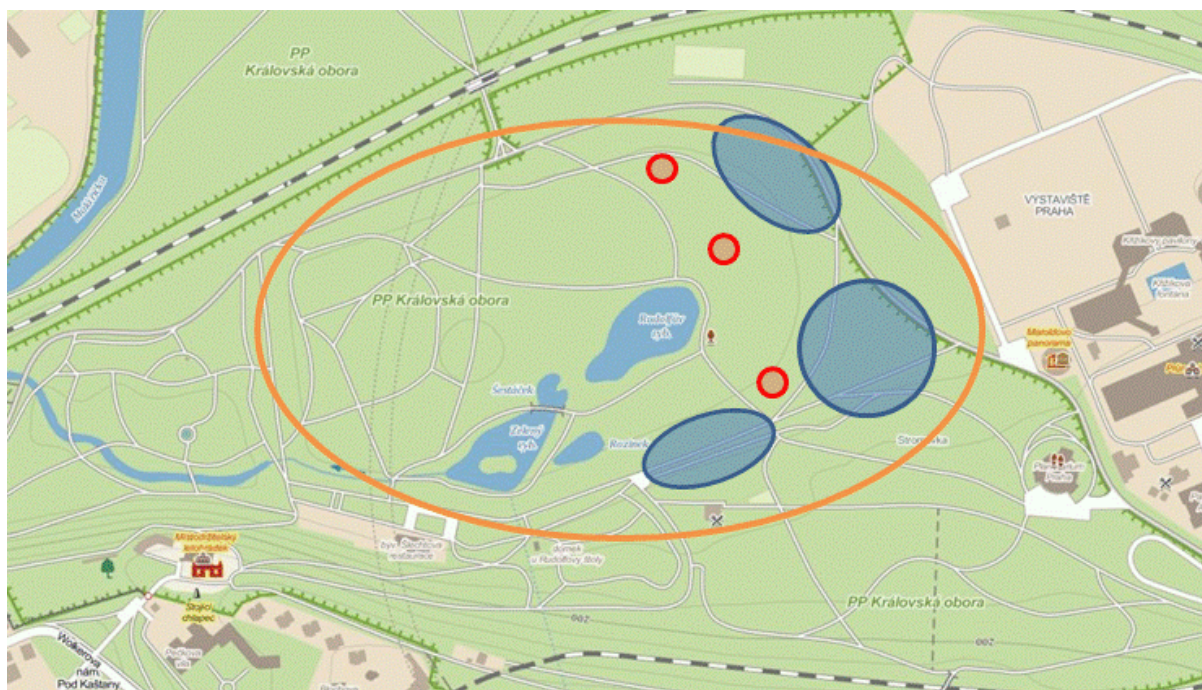
Obr. 4 Na mapě jsou vyznačená zkoumaná území jednotlivých aktivit. Modře jsou území, kde se pohybovaly týmy zabývající se stromovým porostem park. Červeně jsou lokality, na kterých zkoumali botanici, a oranžová elipsa znázorňuje území, kde se pohybovaly týmy zabývající se historií a současností cestní sítě.

vysazené stromky, u kterých jsme nevěděli co za druh to je. Velice rychle také vyplnili celou tabulku, tak jsme jim jí rozšířili i na druhou stranu papíru.