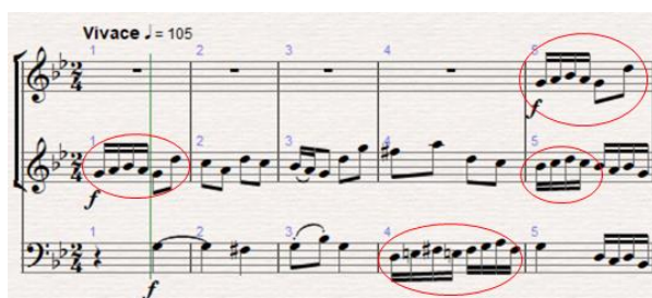
Obr. 9: Hlavní téma páté věty (první čtyři takty); červeně označeny hlavy tématu