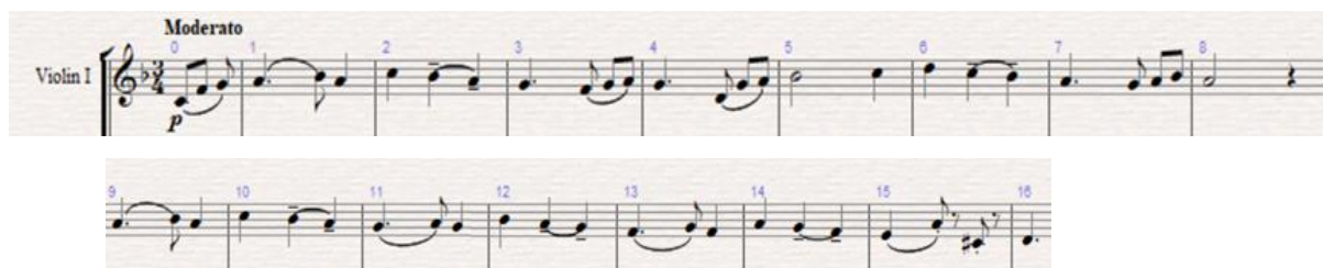
Obr. 7: Téma čtvrté věty