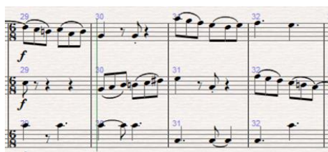
Obr. 5: Vedlejší šestiosminové téma třetí věty