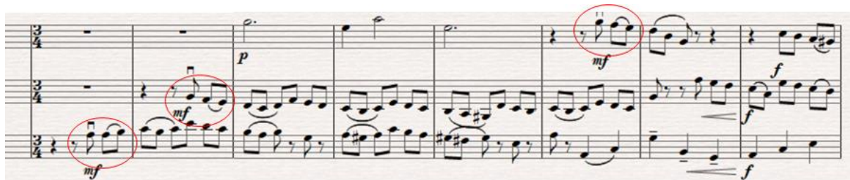
Obr. 3: Motiv mezihry ve druhé větě