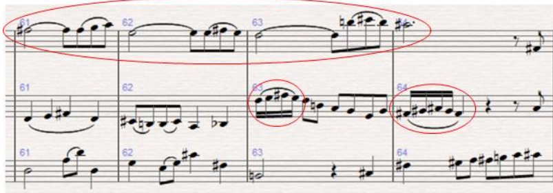
Obr. 6: Citace tématu druhé věty a hlavy tématu věty páté